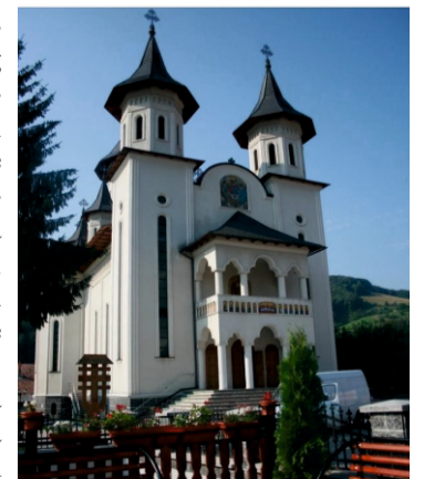
Biserica din Feldru